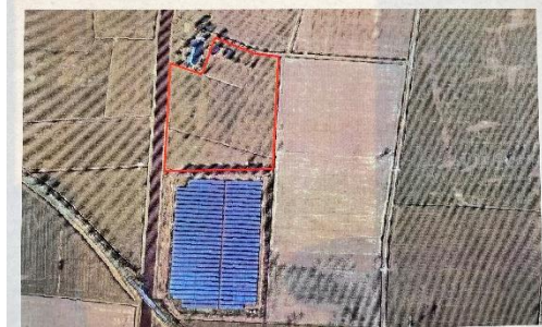
Figuur 2: Luchtbild plangebied en directe omgeving.